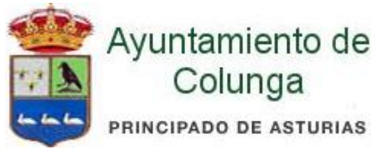
José Ángel Toyos Alcalde de Colunga